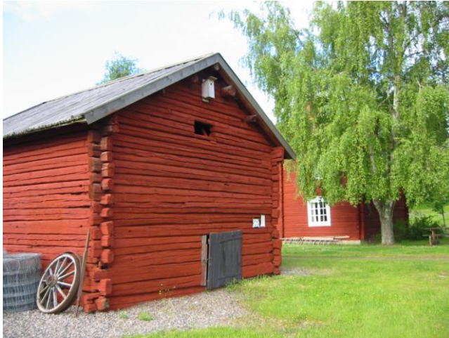
Torkria som flyttats från Finntorpet Aspmoren till Norrbärke Hembygdsgård.

En omsvängning i myndigheternas syn på skogen, ca 1640, medförde att invandringen avtog. Då bergshanteringen växte och skogen behövdes bl.a. till gruvorna ansågs svedjebruket efter en tid som skogsskövling. Genom lagar och skogsordningar begränsades svedjandet. All skog, utom strax intill byarna, tillhörde kronan och den arrenderades nu ut till bruken mot en viss avgift.