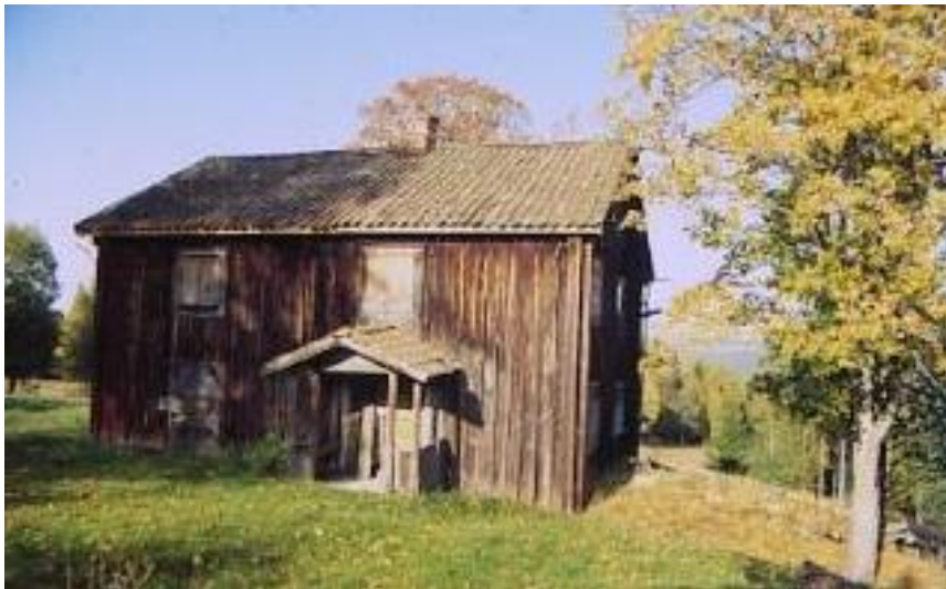
Skomakartorp Malingsbo 1992. Gården uppges som den äldsta i byn Källan, där det 1629 bodde två skattlagda finnar. Den enda f.d. Finngård i kommunen som inte har ägts av Domänverket.