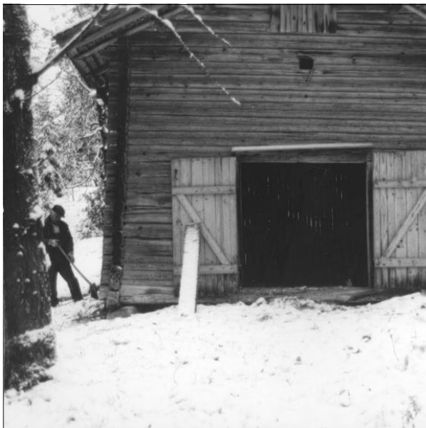
Rian i Talltorp. Foto kultursekr. Pia Hilborn, Smedjebacken 10

Svedjebruket krävde stora skogsarealer. Därför kom finnbyarna att ligga i gränstrakterna mellan olika socknar och ganska jämt spridda över stora områden. Endast ett mindre antal gårdar fanns i varje by. De mest typiska byggnaderna var pörtet eller rökstugan - en bostad utan fönster och skorsten, rian - där säden torkades - samt bastun. I slutet av 1700-talet började pörtet förses med fönster och skorsten och blev en sk svenskstuga. Inga pörten är bevarade i Västerbergslagen. Dock finns två bevarade Rior, en på ursprunglig plats i Talltorp och en på Norrbärke Hembygds gård.